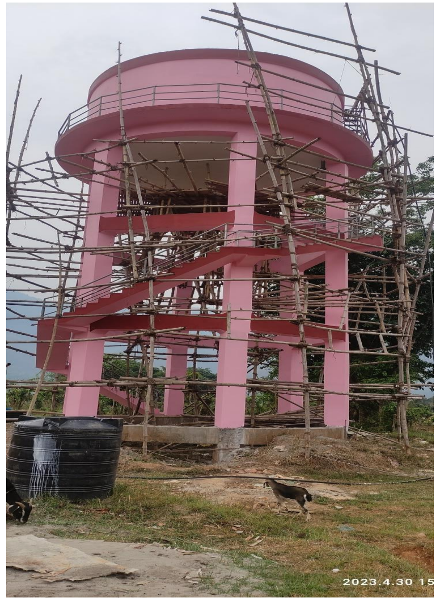
बेलचौर खा.पा. आ. चापाकोट स्याङ्गजा