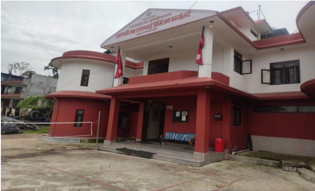
खानेपानी तथा सरसफाई डिभिजन कार्यालय स्याङ्जा नेपाल

२०८२ श्रावण देखि चैत्र मसान्तसम्म सम्पादित प्रमुख क्रियाकलापहरूको विवरण